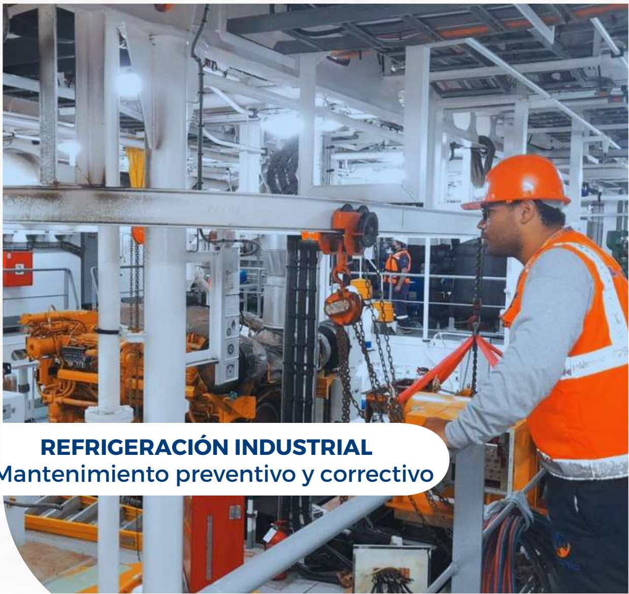
REFRIGERACIÓN INDUSTRIAL Mantenimiento preventivo y correctivo

Comedores Industriales | Procesadoras de Alimentos | Industria Cárnica | Industria Pesquera | Industria Hotelera | Hospitalario